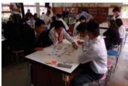
図2 モデル授業風景

先生がカードを読み、生徒が札を取るカルタゲームと、食う食われる関係の花札ゲームを行ない、外来種問題を遊びながら理解しました。