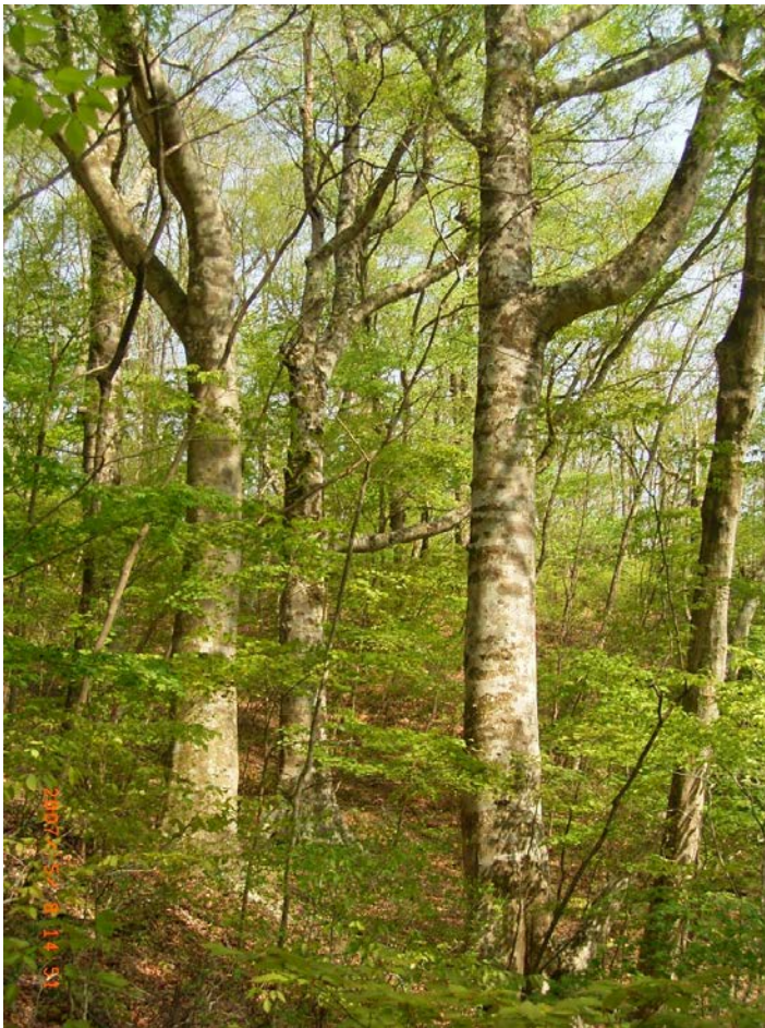
6ha の調査区が設定されている小川試験地の林相