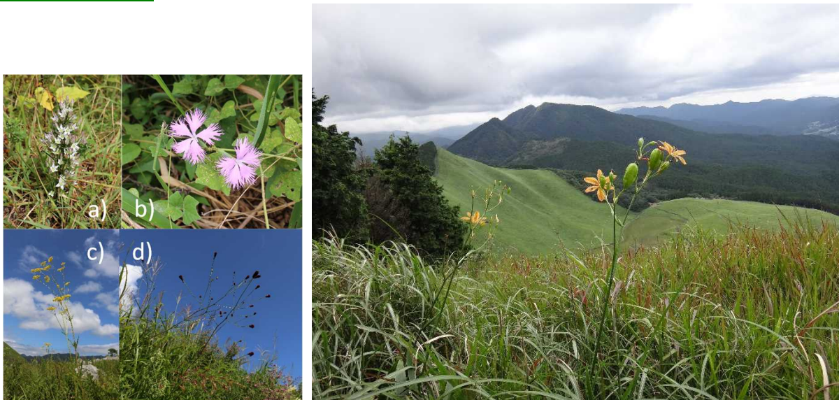
図 1. (左) 草地に特化した 4 種の対象草本植物。(a) センブリ、(b) カワラナデシコ、(c) オミナエシ、(d) ワレモコウ。(右) 野焼きによって維持されている代表的な草地 (奈良県・曽爾高原)。