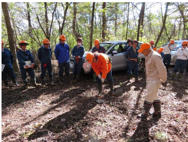
(H30 ニホンジカわな研修の様子)