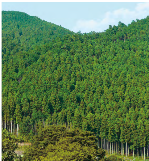
写真2 森林計画制度によって植え育てられてきたスギ人工林

考え方を取り入れるなど、大胆な制度変更を企図しました。しかし、そうしたGHQの改正案は必ずしも日本の実情と合わないと考えた林野庁や林業界との間でしばらく駆け引きが続きました。その結果、昭和26(1951)年の森林法改正によって、GHQと日本政府の2つの考えを折衷して誕生したのが現行の森林計画制度でした。 最初に森林計画制度が誕生してから、すでに70年近い歳月が経ちました。敗戦後の廃墟の中から立ち上がった日本は、高度経済成長期を経て、現在、21世紀の環境の時代の中にあります。森林計画制度の成立過程を明らかにした本研究成果が、制度の本質を理解する手がかりを与え、これからの日本の森林管理制度の発展に寄与することができればと願っています。