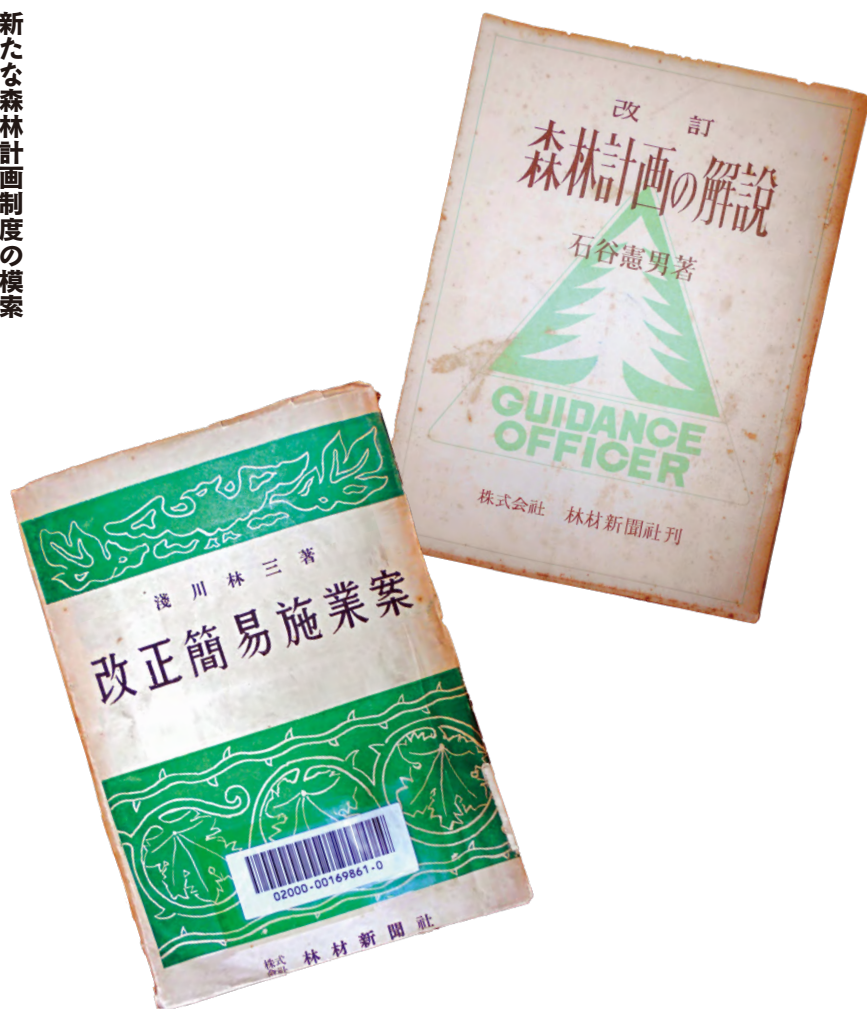
写真1 昭和14(1939)年(下)と、同26(1951)年(上)の制度改正時の解説書

将来に向けてより良い森林計画制度を構想するための方法には、様々なアプローチが考えられます。本研究では、制度成立の原点まで遡り、制度がどのように生まれて来たのかを解明することによって、制度の本質を明らかにすることができるとは、ないかと考えました。そのため、専門書、業界誌記事、座談会記録、省令などの公文書といった様々な史料を渉