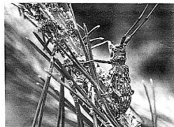
マツノマダラカミキリ成虫