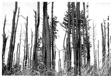
マツ材線虫病によって全滅したアカマツ林

釜山市の山林面積の70%（12, 600ha）はアカマツ・クロマツ林です。韓国全体にとってもこの2種のマツは我が国よりも重要な地位を占めています。初期段階で強力な対策をとらないと、日本と同様の惨状になりかねません。