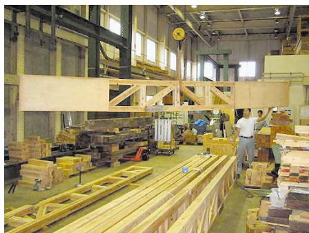
図7 平行弦トラスとボックスビームの併用梁