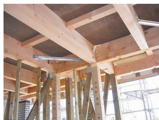
図1 梁の方が柱より太い

そこで、小断面の木材や木質材料を、複合させたり、組み立てたりして、軽くて強度性能の高い組み立て梁を製造する方法が開発されてきました。