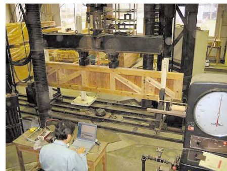
図9 スギ厚物合板を用いたIビーム（斜材付加）