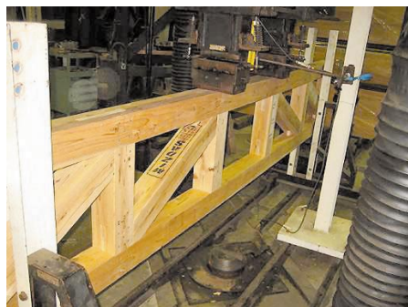
図8 改良型平行弦トラス