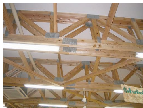
図4 店舗の梁に用いられたメタルガセット平行弦トラス

I ビームやボックスビームのウェブの部分を軸材に置き換えて、三角形を組み合わせたトラス構造にしたものが平行弦トラスです。この種の平行弦トラスで最もよく使われているのが、材と材の節点にメタルプレートコネクター（メタルガセット、ネイルプレート）を圧入したメタルガセット平行弦トラスです（図4）。この組み立て梁は、製造工程が単純で安価なため、北米ではDIY店などでも市販されています。