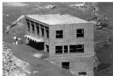
写真 平成6年の渇水で湖底から姿を現した旧大川村役場

そのため四国支所では、上流地域の森林管理費用の負担に関する基礎資料を整備するために、平6 渇水の経過を記録するとともに、これを契機として上流地域の水源林の維持・管理に関する下流域住民の意識がどのように変化したのか、そして現時点での下流域と上流水源地域との水源林を巡る交流にはどのような特徴がみられるのかを調べました。