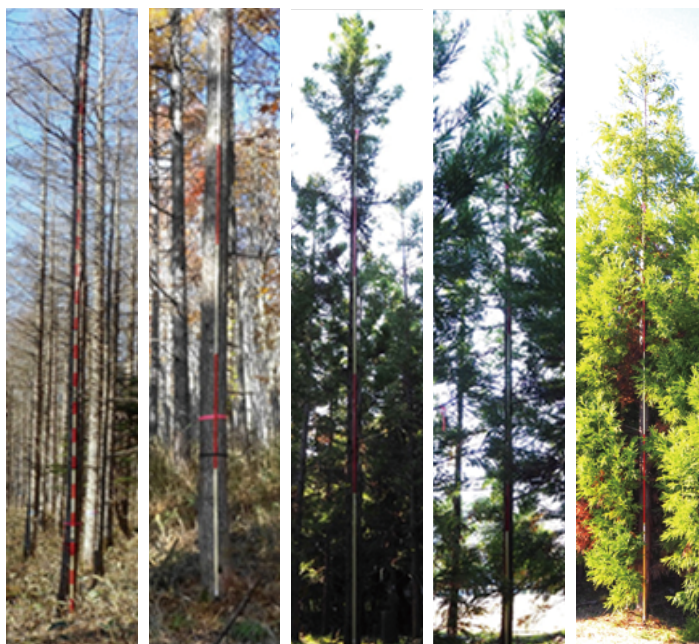
図1 開発された初期成長に優れた第2世代品種

左から、カラマツ東育2-16号、カラマツ東育2-68号、スギ林育2-200号、スギ林育2-288号、スギ林育2-289号