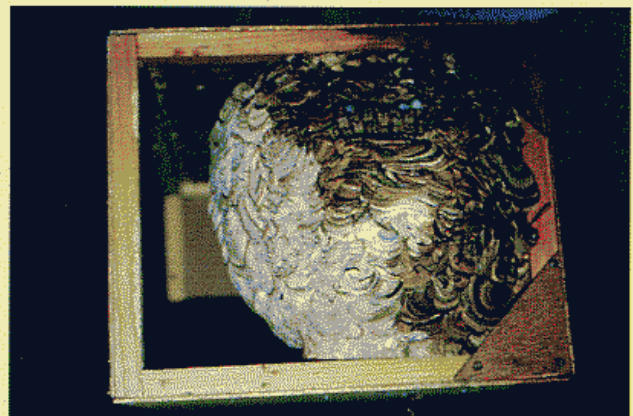
【屋内に造られたキイロスズメバチの巣】

林業作業では、事前にハチが生息しているか調べることも大切です。そのために、ペットボトルにハチの入る穴を開け、ハチの好む液（酒、砂糖、酢の混合液）を入れた誘引器が利用されています。スズメバチなどが捕獲されたら、作業を慎重に行う必要があります。