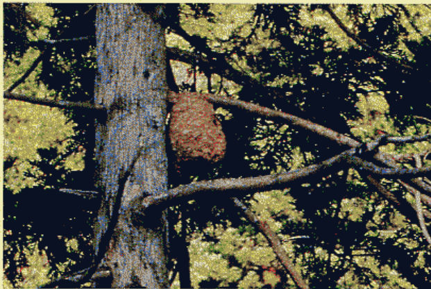
【樹上に造られたキイロスズメバチの巣】

ハチは殺虫剤に大変弱く、家庭用のスプレー式殺虫剤で容易に撃退できます。特に、ハチの集団に襲われた場合は、殺虫剤の使用で被害を広げないようにすることができます。現在はハチ専用のものが開発されていて、小型で携行にも便利になっています。