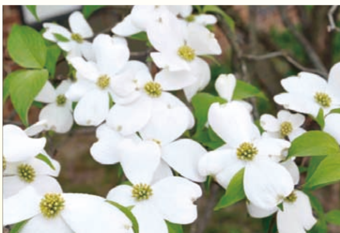
図1：ハナミズキ ( Cornus florida )