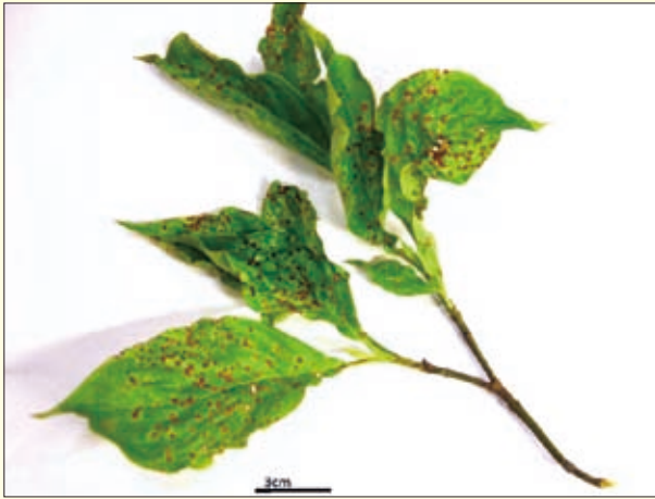
図2：北米のミズキ類炭疽病の発病葉