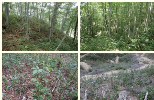
写真1 皆伐前のブナ二次林と皆伐後の様子 (左：ブナ純林、右：混交林)

多雪地域である山形県置賜（おきたま）地方のブナ二次林で、皆伐後の更新状況を調査しました。皆伐前の二次林は、(1)ブナが9割を占める純林と、(2)ブナが6割でミズナラとその他の落葉樹が4割を占める混交林の2タイプがありました（写真1）。これらの二次林を皆伐した翌年に切株からの萌芽本数を調べたところ、純林で調査した26本の切株ではどの樹種でもほとんど萌芽