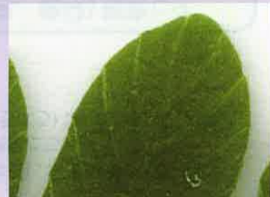
葉脈が葉縁に届く