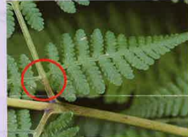
小羽片に柄がある