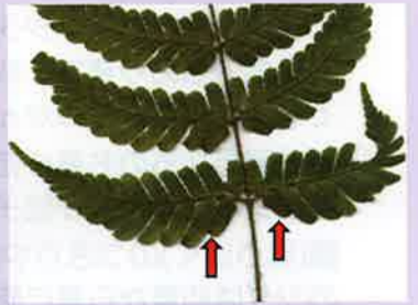
最下羽片の下向き第1小羽片は隣の小羽片より小さい