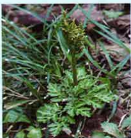
胞子嚢が丸いつぶつぶ