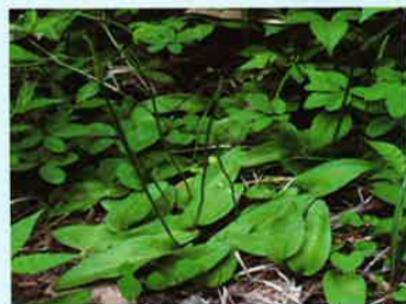
靴べらのような葉が一枚