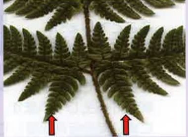
最下羽片の下向き第1小羽片が大きく張り出す